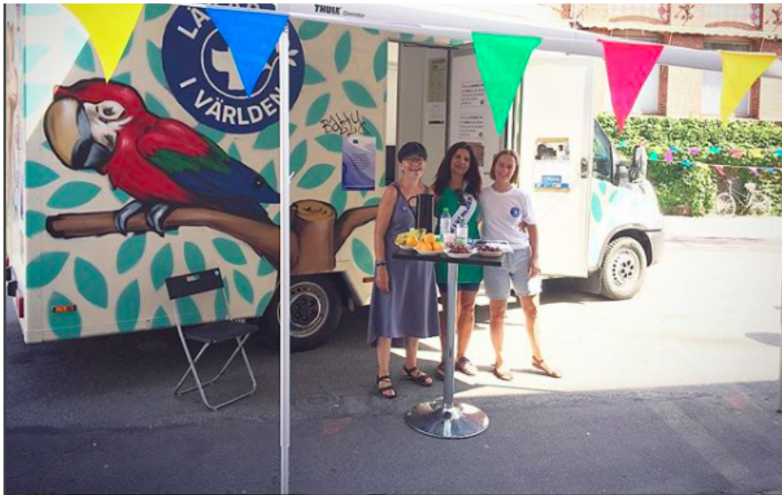
Läkare i Världens mobila klinik på Malmö feministiska festival.